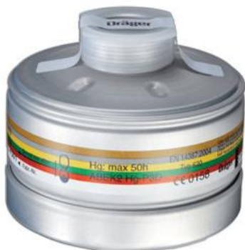
Chlor-Filter B2P3 Art.-Nr. LW 51103