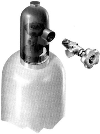
Notfallausrüstung 65 kg Flasche, Ventilbereich