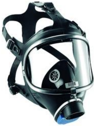
Maskenkörper Art.-Nr. LW 51101