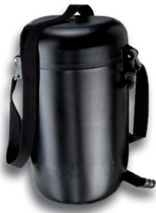
Maskenbüchse Art.-Nr. LW 51102