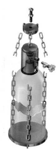
Notfallausrüstung 50 kg Flasche, Ventilbereich